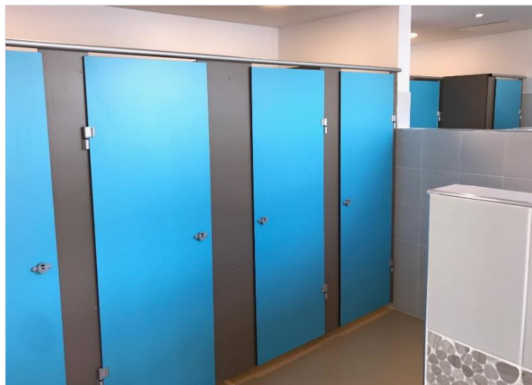
Ecole St François d'Assise – 92 Boulogne-Billancourt (Ferreira)