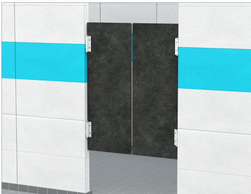
Charnières double action type DAW montées directement sur les têtes de mur