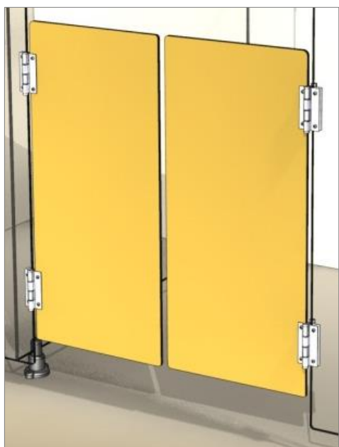
Porte western intégrée à une façade de cabines