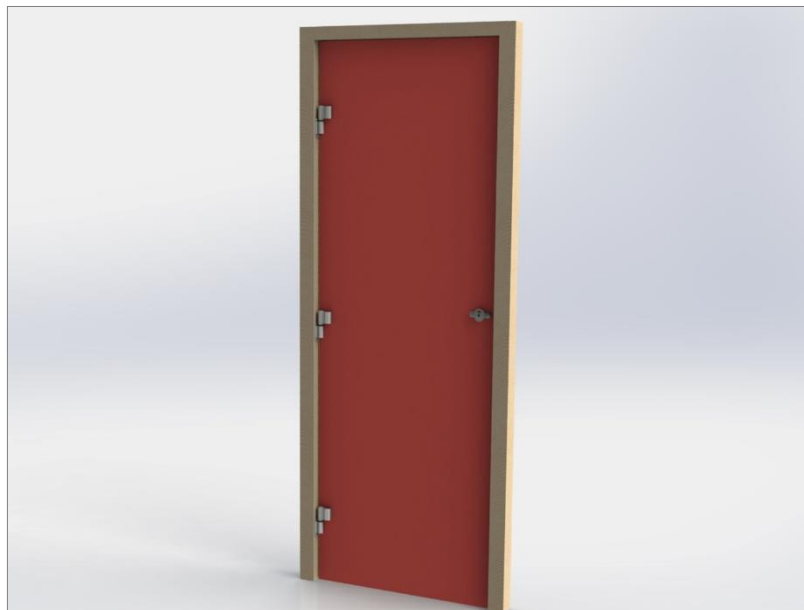
Porte sur huisserie bois avec 3 paumelles cabines + verrou cabine